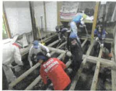
▲ボランティアで床下の汚泥除去