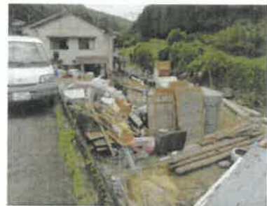
▲大量の災害廃棄物