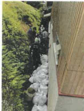
▲住宅裏の斜面崩落土砂撤去