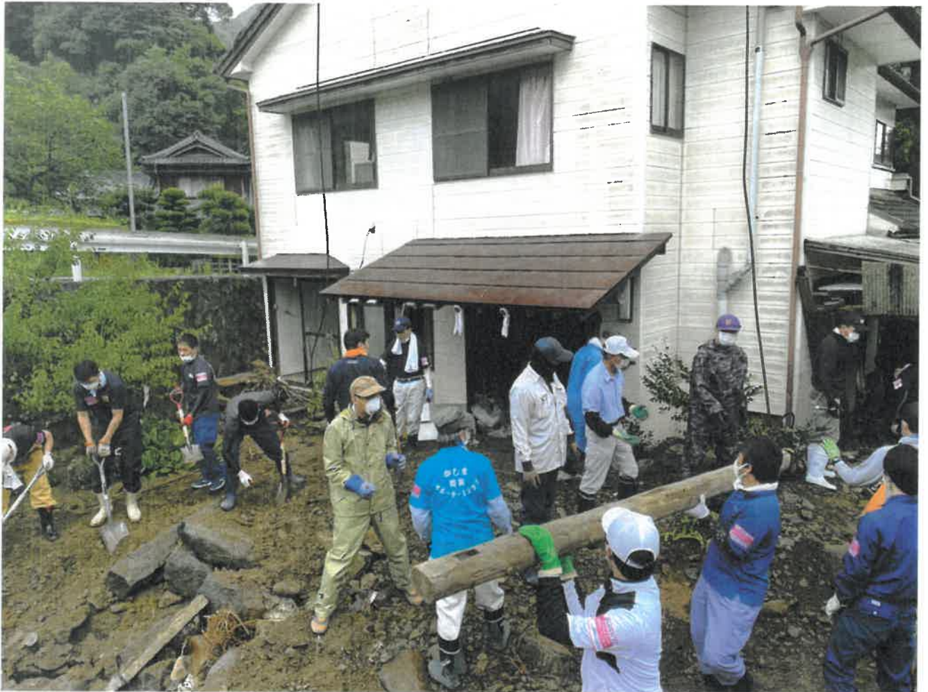
能古見山浦(長野)での災害ボランティア活動