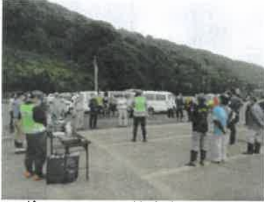
▲ボランティアに注意事項を説明

鹿島市社会福祉協議会では、発災5日後の7月11日から被災者支援として災害ボランティア活動を行いました。新型コロナウイルスの影響でボランティアが集まるか心配しましたが、7月31日の閉所までの間で被災者からの依頼が32件あり、ボランティアも448人（うち市外118人）が参加、復興に向け支援をいただきました。さらに災害ボランティア活動の運営についても地元の市民活動団体などから支援をいただいたことでスムーズな運営をすることができました。ご協力いただいた皆様に感謝申し上げます。