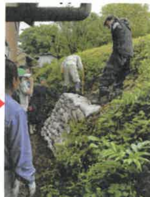
▲崩落斜面を土のうで補強